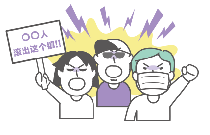
煽动当地社会排斥的言行