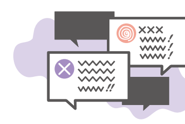
有损个人尊严的文字